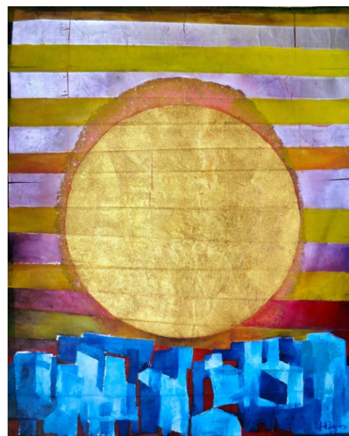
Mundos Lusófonos VI

Óleo, ouro e prata s/ tela 127cmx100cm 2012