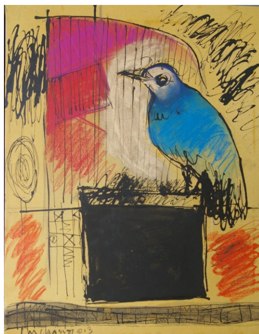
Pássaro azul com gaiola vermelha , Técnica mista s/tela, 50 x 40 cm, 2013