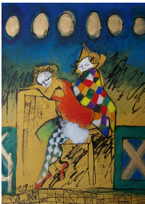
Momento de repouso , Técnica mista s/tela 50 x 40 cm, 2013