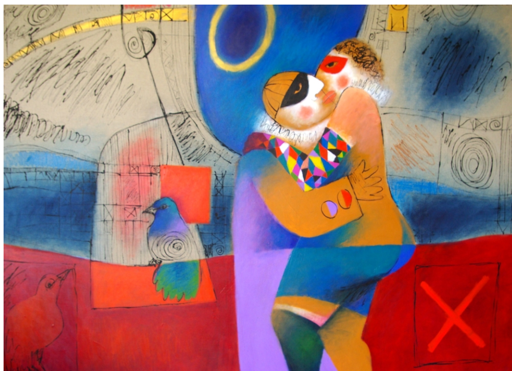
Encantamento de columbina e Pierrot, Técnica mista s/tela, 150 x 200 cm, 2013

O MAC- Movimento Arte Contemporânea, inaugura no próximo dia 2 de Maio, quinta-feira, pelas 19 horas, a exposição individual de pintura de Roberto Chichorro na Avenida Álvares Cabral, 58-60, em Lisboa.