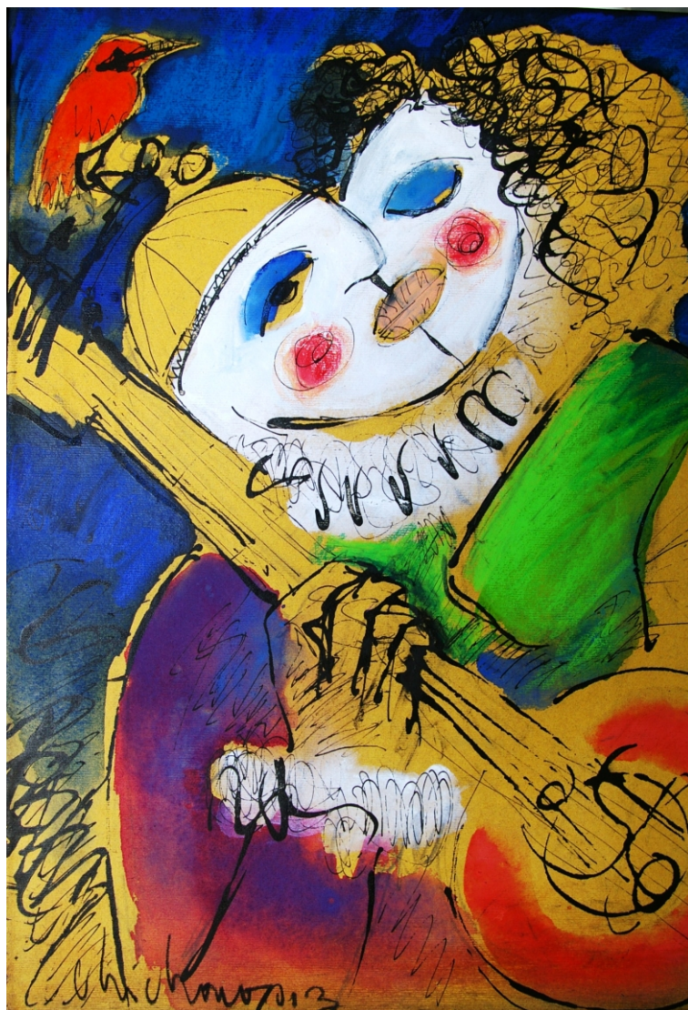
Namoro em dia de carnaval , Técnica mista s/ tela, 50 x 40 cm, 2013