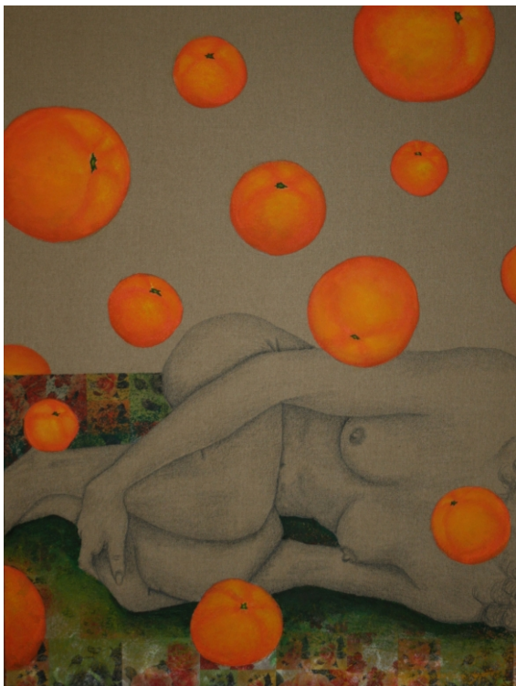
SERENAMENTE TÉCNICA MISTA S/ TELA 80X60 2010