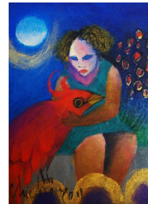
Namoro com Pássaro Cornudo, Acrílico s/tela 27x22, 2011