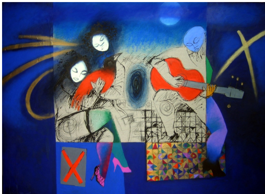
Concerto para Pássaro Vermelho Acrílico s/tela, 150x200, 2011