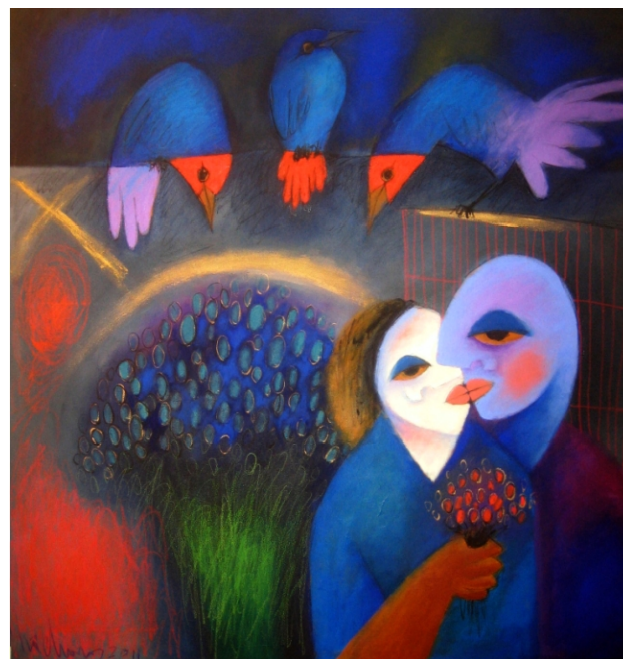
Namoro Embandeirado por Pássaros, Acrílico s/tela 120x120, 2011