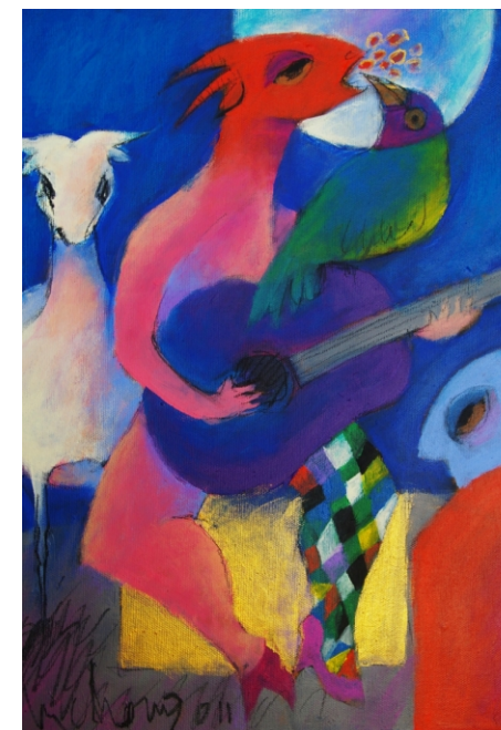
Baile de Cabritos com Beijo Florido, Acrílico s/tela 30x40, 2011