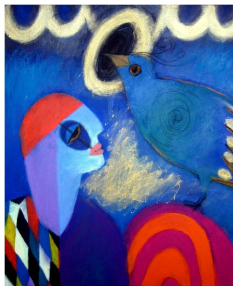
Pássaro Circense Acrílico s/tela, 60x50, 2011