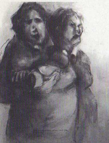
"A galinha da vizinha" Óleo s/ tela 100x81