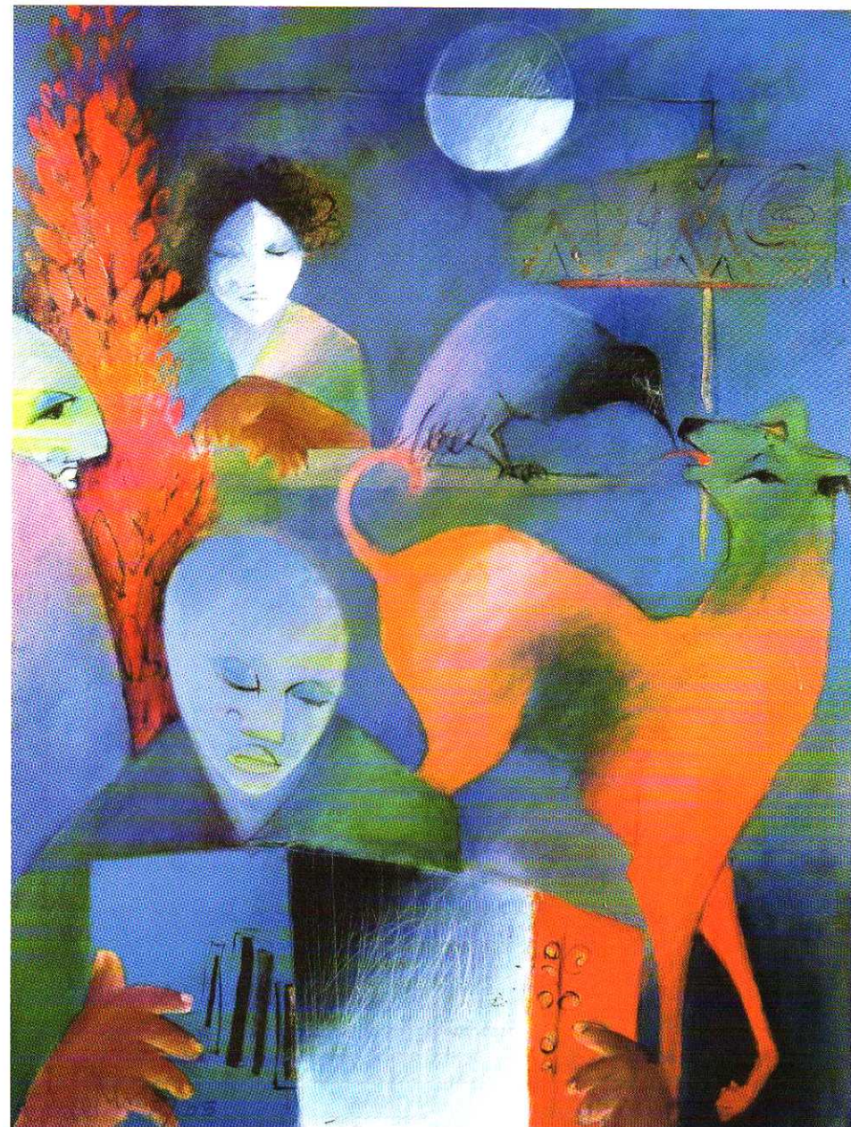
CONCERTO PARA BEIJO DE CÃO DE COR LARANJA (acrílico sobre tela) - 116x89 cm