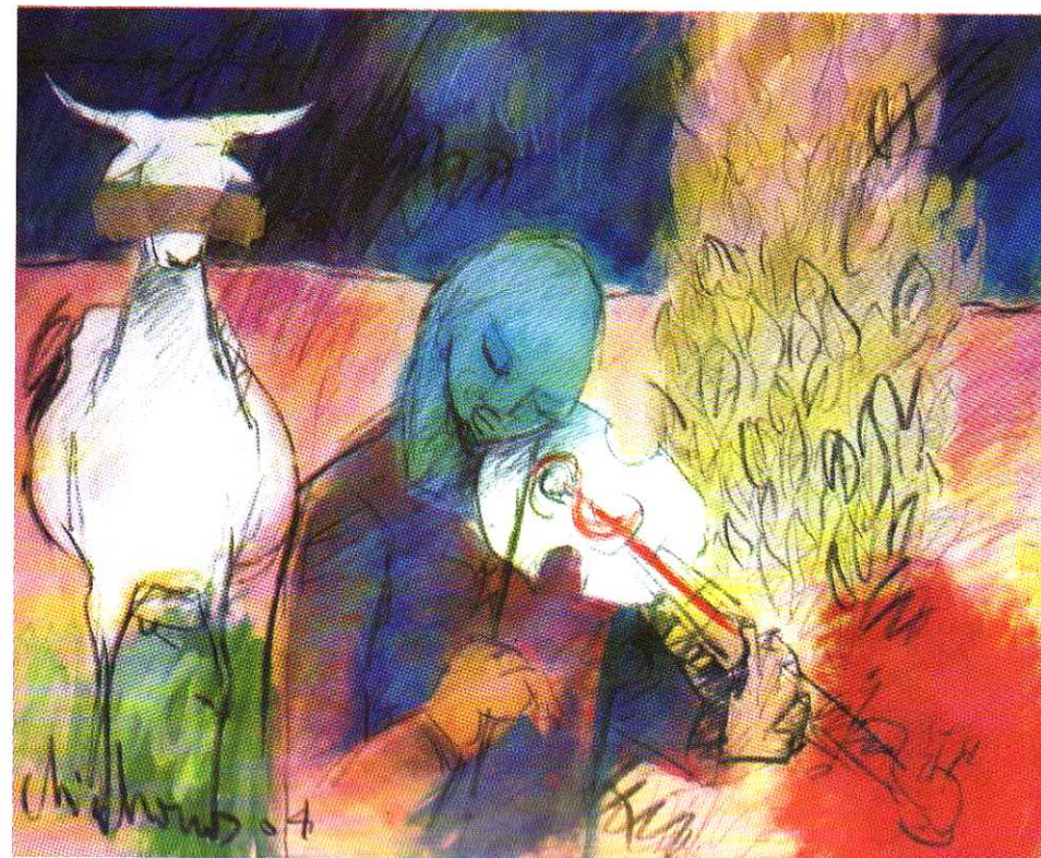
CONCERTO DE NOITE COM CABRA CEGA (acrílico sobre tela) - 80x100 cm